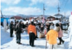
水沢雪まつりひろば