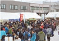
駅前イベントひろば