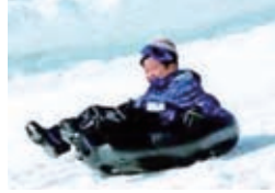
スノーランド新座4