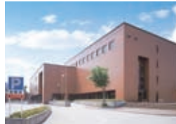
道の駅 クロステン