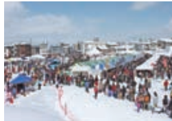
コミュニティひろば