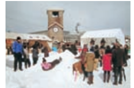
ふれ愛ひろばほくほく