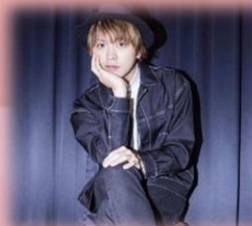
H.M.C(ハイメリークレシンド)