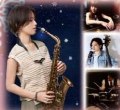
縹縹歩美カルテット