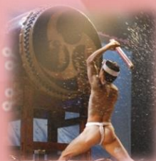
和太鼓集団「鬼太鼓座」