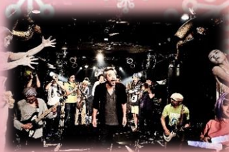
渋さ知らズオーケストラ