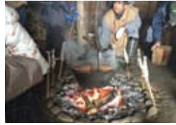
中条笹山縄文ひろば