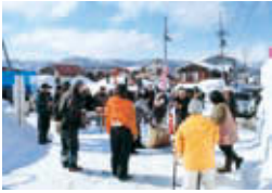
水沢雪まつりひろば