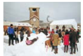
ふれ愛ひろばほくほく