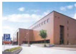
道の駅 クロステン