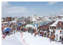
コミュニティひろば