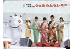
交流都市観光親善大使