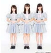
シュークリームロケッツ