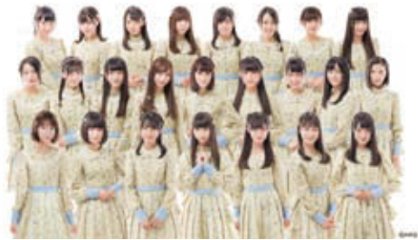
NGT48 (十日町雪まつり雪上カーニバル選抜メンバー)