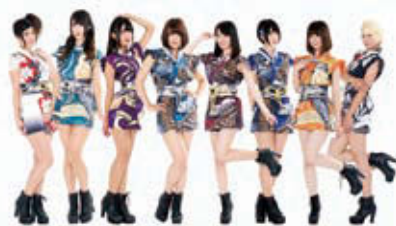
演歌女子 ルピナス組