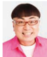
イジリー岡田 (ステージMC)