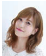
大島麻衣 (ステージMC)