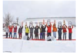
雪の芸術展表彰式